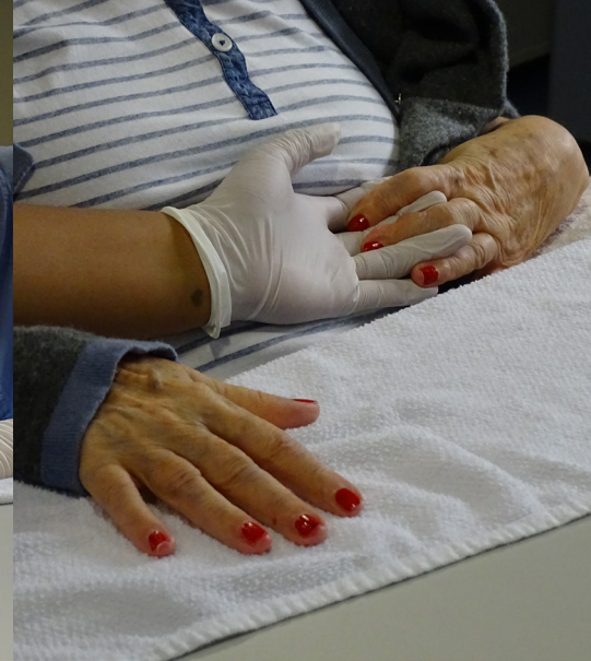
de l'exposition itinérante