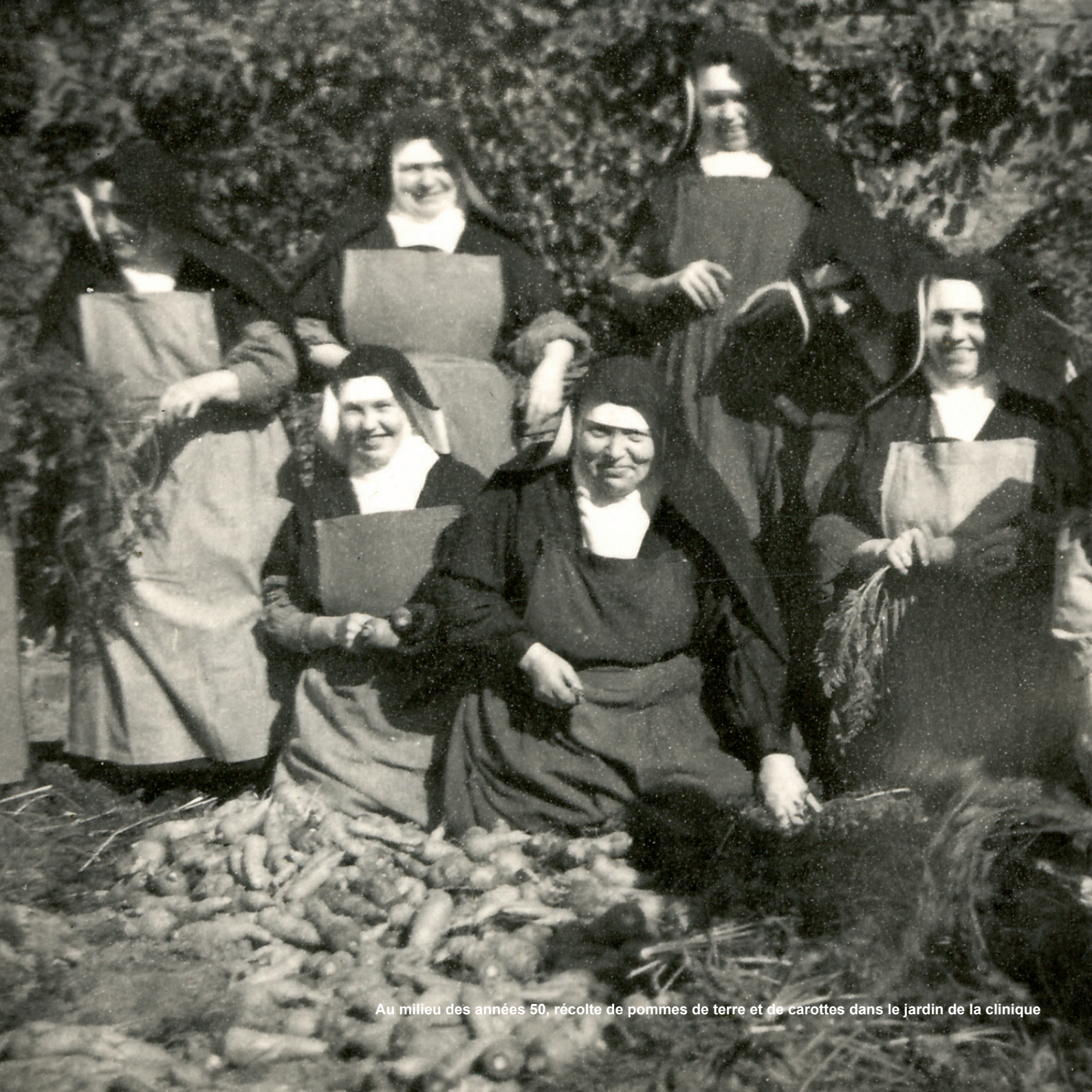
Au milieu des années 50, récolte de pommes de terre et de carottes dans le jardin de la clinique